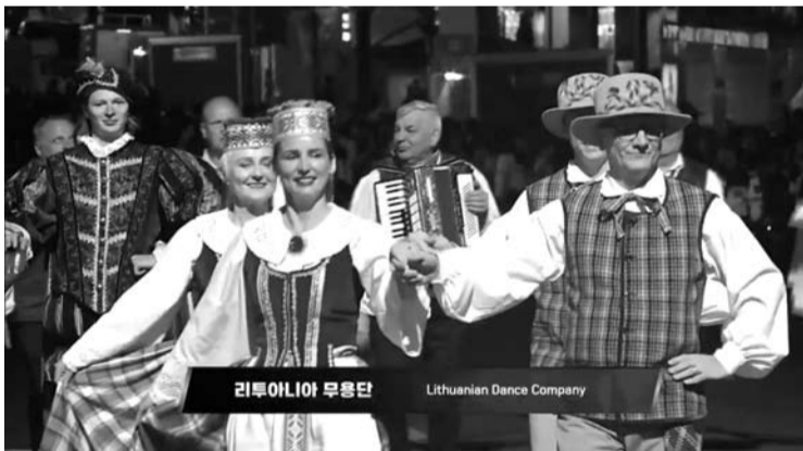
Anykščių kultūros centro šokių ansamblis „Gojus“ Pietų Korėjoje pristatė lietuviškus šokius ir pateko į festivalio-čempionato finalą.