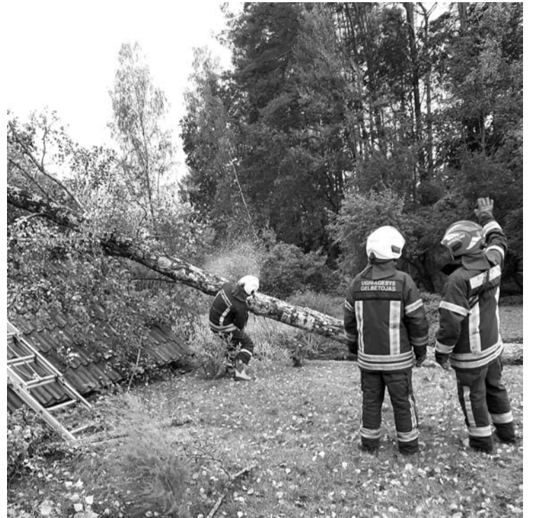
Ugniagesiai gelbėtojai pašalino medį ir neprašomi sulopė stogą.