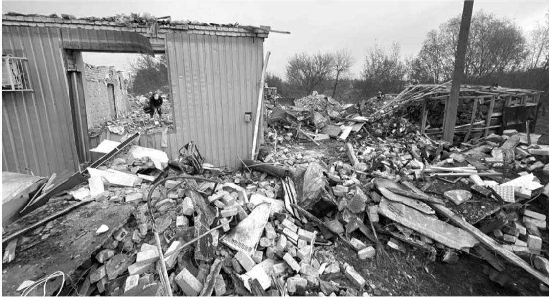
Kavinė Hrozi kaime virto griuvėsiais.

Į Hrozi kaimelį, nutolusį 85 kilometrus nuo Charkovo, gelbėtojai atvažiavo labai greitai, tačiau sprogimo epicentre buvusiems padėti nebegalėjo. Mat prieš paleista galinga bomba „Iskander“ į dalis sudarkė visus, kas buvo atėjęs į gedulingus pietus.