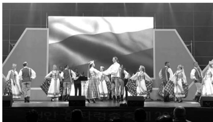
Šokių kolektyvas „Gojus“ reprezentuoja Lietuvą.

je-konkurse. Konkurse dalyvauja 15 šalių. Atranka ir konkurencija buvo išties didžiulė. Dalyviams reikėjo gauti ne mažiau trijų tarptautinių šokių festivalių rekomendacijas. Dabar teks sulaukti vadovės ir konkurso dalyvių, kad išgirstume išsamų jų pasakoji-