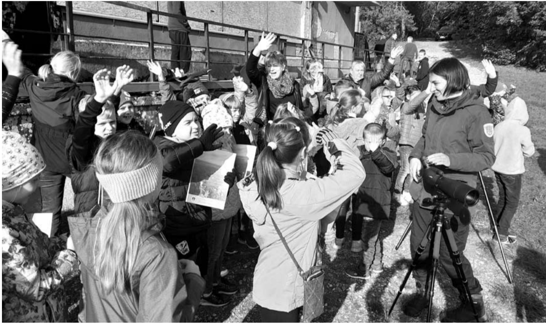
Paukščių palydų šventėje dalyvavo Kavarsko pagrindinės mokyklos-daugiafunkcio centro mokiniai kartu su savo mokytojais.

Į renginį trimis mokykliniais autobusiukais buvo atvežti Kavarsko pagrindinės mokyklos-daugiafunkcio centro mokiniai kartu su savo mokytojais.