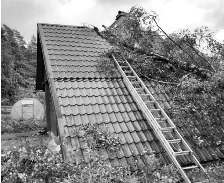
Pirties stogui nuolat grasina svetimame sklype augantys beržai.

Šeštadienį per audrą beržas užvirto ant sodų bendrijoje esančios pirties. Į įvykio vietą atvažiuavę ugniagesiai gelbėtojai ne tik „išlaisvino“ pirtį, bet ir sutvarkė stogą.