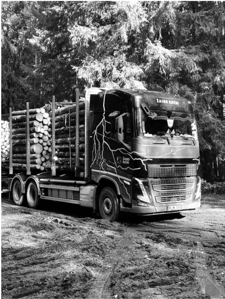
Miško gelbėtojams nerimą kelia Šimonių girioje didėjantys plynų kirtimų plotai.